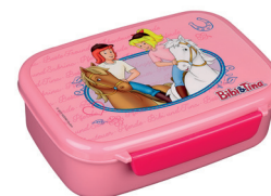
scooli Brotzeitdose mit herausnehmbarem Einsatz Sandwich box with compartment BITI9903 inner 6 | outer 48