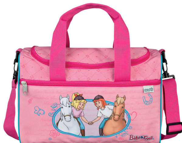
scooli Sporttasche Sportsbag BITI7252 inner 6 | outer 36